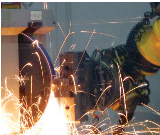
Enlèvement de matière - inox 304